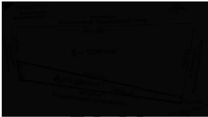
[Levantamiento topográfico anexo al dictamen del perito designado por el actor]