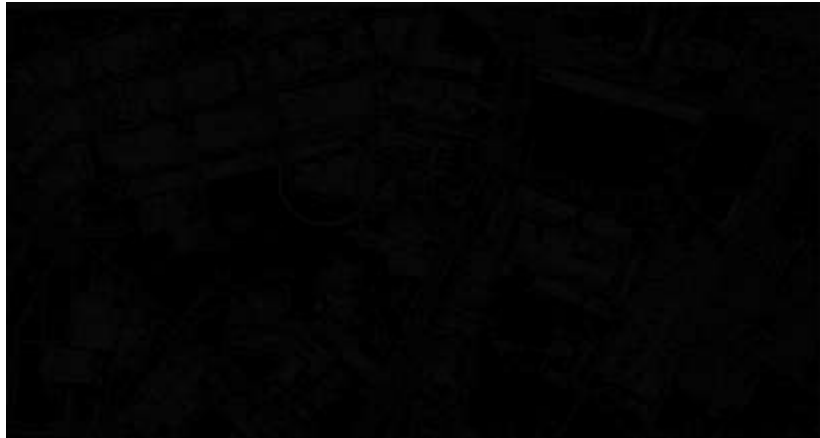
[Plano de localización anexo al dictamen del perito tercero]