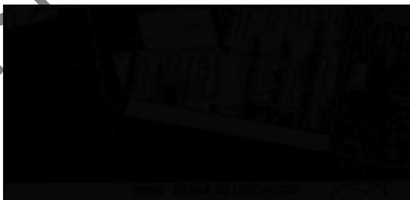
[Plano de localización anexo al dictamen del perito designado por el actor]

Ello, tal cual lo ilustran los planos de localización y levantamientos topográficos que obran insertos en los dictámenes rendidos por el perito del actor y por el perito tercero, mismos que se insertan a continuación: